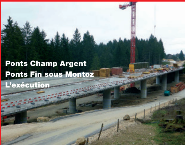
Ponts Champ Argent Ponts Fin sous Montoz L'exécution